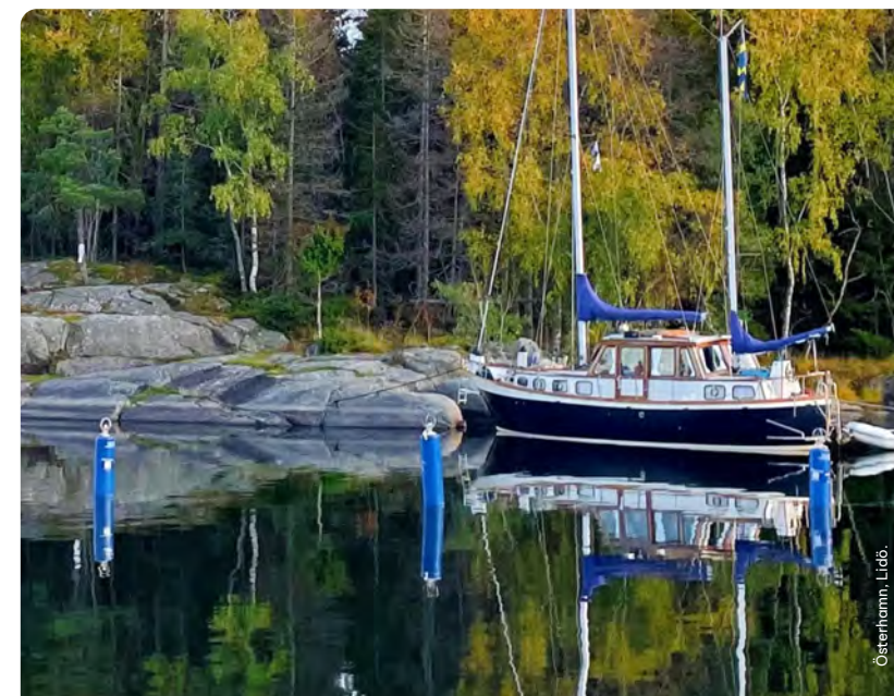
Foto: Österhamn, Lidö