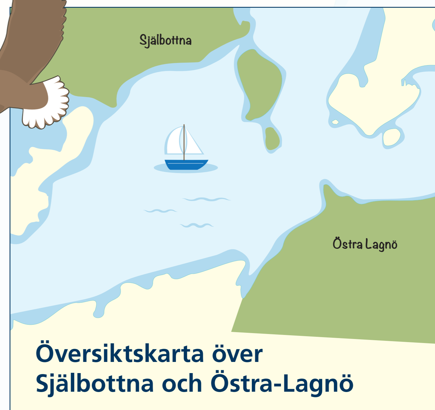
Översigtskarta över Sjöböttna och Östra-Lagnö